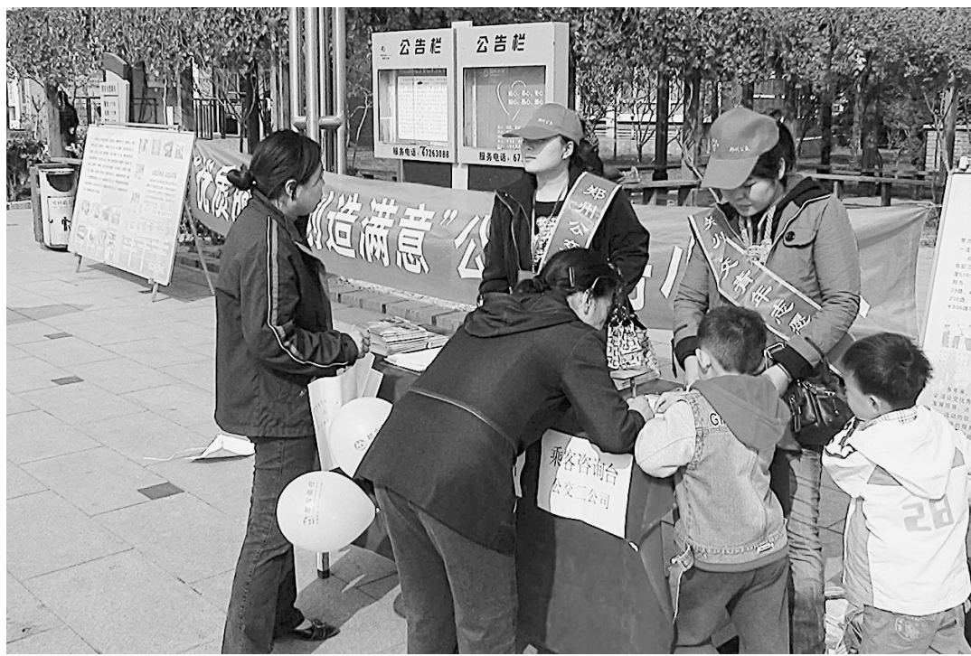
8日、9日,市公交公司组织上千名志愿者成立“公交服务小分队”,走进社区征求市民意见,两天收集建议上万条,发放乘车指南28000余份。

能源审计和企业自主能源审计两种类型。凡是建设项目申请享受各级政府财政性节能补贴、节能奖励或其他节能优惠政策,或者在能源利用过程中违反节能法律法规,未达到节能标准,单位产品能耗超过能效限额标准的企业,一经发现,都必须进行政府监管能源审计。能源审计内容主要包括重点工艺能耗指标与单位产品能耗指标计算分析、企业合理用能的建议与意见等。 企业能源审计结果经各级节能主管部门审核后,必须在一个月内报省发展改革委备案,作为企业评优评先、申报节能项目和享受有关优惠政策等依据。