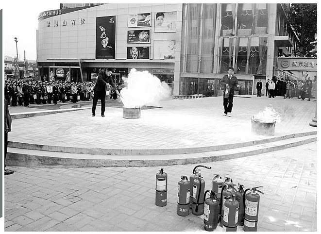
6日,时计宝紫荆山百货针对员工消防自救意识薄弱,缺乏灭火器使用知识等问题,开展消防实战演练。