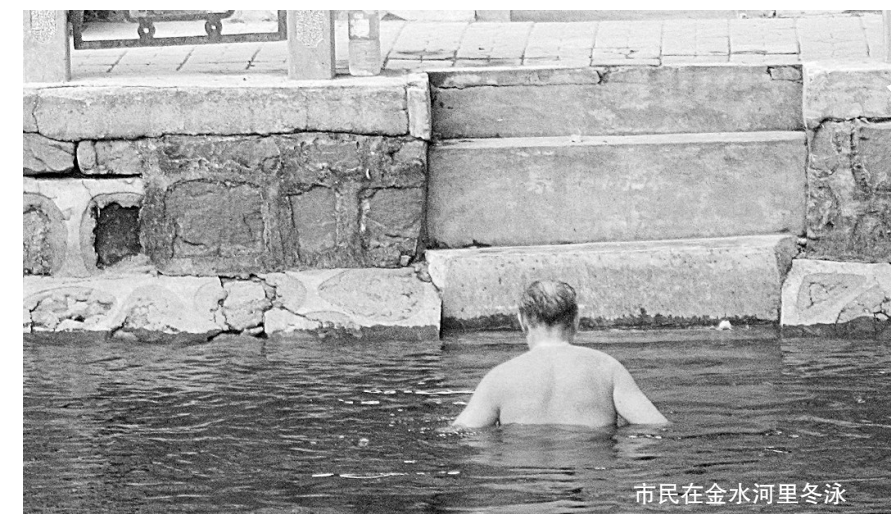
市民在金水河里冬泳

本报讯(记者 梁晓文/图)虽然已经进入冬季,但渐渐变冷的天气并没有阻止游泳爱好者的脚步。昨日,记者在金水河郑州大学段的河内,看到几名老者正在水中畅游,金水河俨然成了一个免费的游泳场。