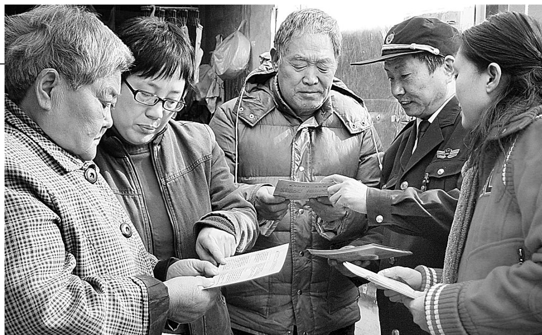
全市开展的冬季打击“两抢一盗”,建设平安社区活动中,南关街道办事处建立起社区工作人员、民警、巡防队员、居民“四位一体”的治安防范机制。图为花园春社区工作人员和社区巡防队员向居民发放印有预防“两抢一盗”犯罪知识的日历。

通知要求,今后凡临时占用城市道路设置机动车停车场的,必须经城市公安交警、规划、市政主管部门批准,并经城市市政管理机构现场勘测,提出被临时占用的城市道路及周边道路和市政设施改造、变更、加强的意见。需要改造的,由市政设施管理机构择优选择市政专业施工队伍负责施工;经验收后,方可投入运营。