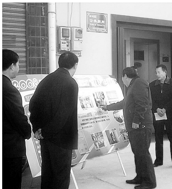
昨日,二七区环卫公共基础设施管理所邀请区人大代表给公厕管理工作“挑刺”,使公厕的管理和服务更上一层楼。

据团市委书记高京燕介绍,团代会吸纳自组织团代表,是团组织引导自组织发展的一项新探索,有利于引导自组织成为团组织的亲密伙伴,成为团组织紧密的外围组织,成为团组织有益的补充力量。今后,我们还将继续考虑在团代会中吸纳更多的自组织团代表参加,扩大青年统一战线。