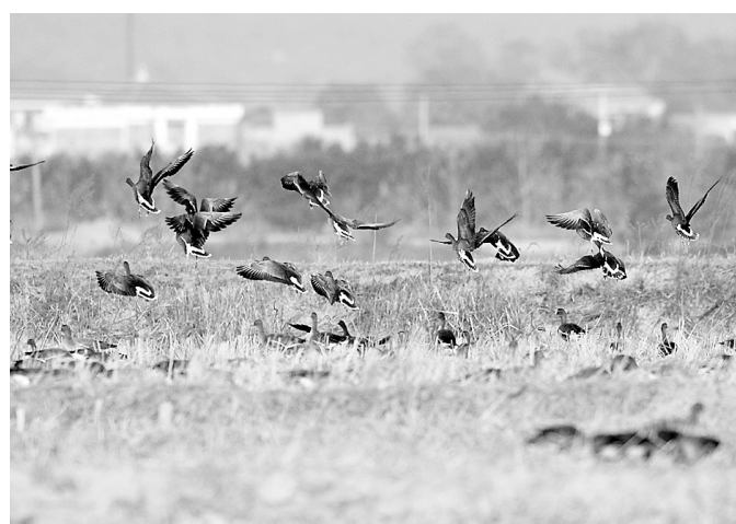
11月19日,一群越冬候鸟在东洞庭湖附近农田栖息觅食。11月初以来,受上游流域降水与水库泄流影响,洞庭湖遭遇历史罕见的冬季水位上涨。11月19日,洞庭湖水位接近28米,大大高于适宜鸟类栖息的24至25米。水位上涨导致鸟类觅食的湿地滩涂缩小,许多候鸟被迫在湖区附近的农田和内陆湖栖息。新华社发

新华社南昌11月19日电(记者 沈洋)江西理工大学的学生近日遇到了一件新鲜事,他们在恋爱过程中将遇到“情感导师”。学校方面希望通过设“情感导师”,帮助学生树立正确的爱情观。 江西理工大学副校长长温和教授介绍说,大学生因为处理恋爱关系不当导致恋爱悲剧的事件时有发生。江西理工大学在全校范围内做过几次调查,发现很多学生没有明确的爱情观,部分学生还因情感问题处理不当影响了学业。鉴于此,学校推出了“情感导师”制度。 温和说,“情感导师”由心理咨询师、礼仪教师、班主任、辅导员以及校外的人际交往学者等兼任。“情感导师”在任期间,将针对大学生的恋爱心理、恋爱礼仪、恋爱行为等方面进行测评,并建立相应的档案;通过一对一约谈、恋爱文化沙龙、恋爱知识讲座、大学生恋爱基础课程等形式,借助校园网、校园广播、辅导员博客、QQ群、飞信群、校报、校园橱窗等平台,帮助学生树立正确的爱情观。 另外,“情感导师”还将定期与大学生情侣进行一对一的“三人面谈”,化解学生的恋爱矛盾,帮助既成情侣愉快、健康的恋爱。