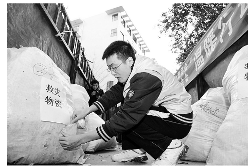
19日,一位中央财经大学的学生在包装袋上贴标签。当日,中央财经大学、中国政法大学等8所高校携手中华思源工程扶贫基金会“温暖行动北川行”活动在中央财经大学举行,6000余件8所高校学生自发组织募集的棉衣、棉被等御寒物资从这里启运,将定向投放到地震灾区四川省北川县擂鼓镇。

据新华社北京11月19日电(记者 周婷玉)卫生部官方网站19日发布的《婴幼儿配方食品和谷类食品中香料使用规定》指出,凡适用范围涵盖0至6个月婴幼儿的配方食品不得添加任何食用香料。 为保护婴幼儿身体健康,进一步规范婴幼儿配方食品和谷类食品中香料使用,卫生部制定了《婴幼儿配方食品和谷类食品中香料使用规定》。这一新规定自发布之日起施行。 规定指出,较大婴幼儿和幼儿配方食品中可以使用香兰素、乙基香兰素和香荚兰豆浸膏,最大使用量分别为5mg/100ml、5mg/100ml和按照生产需要适量使用,其中100ml以即食食品计,生产企业应按照冲调比例折算成配方食品中的使用量。婴幼儿谷类食品(婴幼儿配方谷物粉除外)中可以使用香兰素,最大使用量为每7mg/100g,其中100g以即食食品计,生产企业应按照冲调比例折算成谷类食品中的使用量。 规定明确,2009年9月1日之前,按照以往《食品添加剂使用卫生标准》(GB2760-2007)使用上述香料的婴幼儿配方食品和谷类食品可在保质期内继续销售。