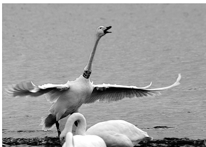
18日,一只颈部佩戴C27环志的大天鹅在山东荣成烟墩角天鹅湖展翅。据介绍,天鹅颈部的彩色环志是全球禽流感监测网络项目为天鹅佩戴的,可跟踪天鹅的迁徙路线。目前,到山东荣成烟墩角天鹅湖越冬的大天鹅已超过500只。新华社发