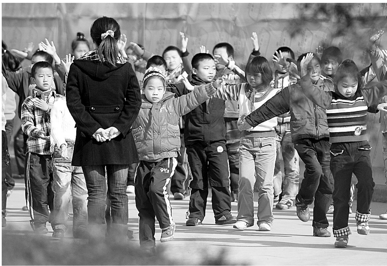
11月19日,孩子们在广播操,身后就是坍塌事故现场的临时围墙。18日,位于杭州地铁工地塌陷事故现场附近的湘湖小学开始恢复正常上课。湘湖小学距离事故塌陷区有50米,经现场勘查,目前不存在次生灾害的危险,专家认为学校可以复课。

据新华社兰州11月18日电 甘肃省紧急采取多项措施妥善处置陇南市武都区发生的冲击市委机关群体性事件,以平息事态,保证社会稳定。18日晚,甘肃省委召开领导干部会议,通报事件有关情况。 陇南群体性事件发生后,甘肃省委、省政府立即成立了工作组,与陇南市、武都区党政领导一起研究采取了几项措施:一是对主要交通路口、重点路段、主要街道实行管制;二是对冲击陇南市委大院的部分人员,执勤民警以十分克制的态度进行清理和疏散;三是通过电视发布市委、市政府公告,讲明事情真相。 截至18日晚,这次群体性事件的事态已得到基本控制。甘肃省委有关负责人表示,发生在陇南市武都区的冲击市委机关的事件,是一次因酝酿中的陇南市行政中心搬迁问题而引发的严重扰乱社会秩序的群体性事件。18日,事态进一步扩大,少数人再次冲击市委机关,行为过激打伤执勤民警。 从17日9时30分开始,甘肃省陇南市武都区东江镇30多名拆迁户集体到陇南市委上访,要求对陇南市行政中心搬迁后他们面临的住房、土地等问题做出答复。 陇南市委和相关部门的干部及时进行了接访,但未与上访人员意见达成一致。当晚,聚集和围观群众陆续增加,部分聚集人员冲击市委机关,砸坏部分车辆和办公设施,打伤维护秩序的武警战士。