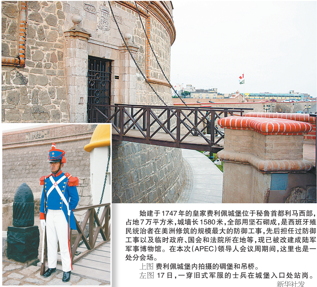
始建于1747年的皇家费利佩城堡位于秘鲁首都利马西部,占地7万平方米,城墙长1580米,全部用巨石砌成,是西班牙殖民统治者在美洲修筑的规模最大的防御工事,先后担任过防御工事以及临时政府、国会和法院所在地等,现已被改建成陆军军事博物馆。在本次(APEC)领导人会议期间,这里也是一处分会场。