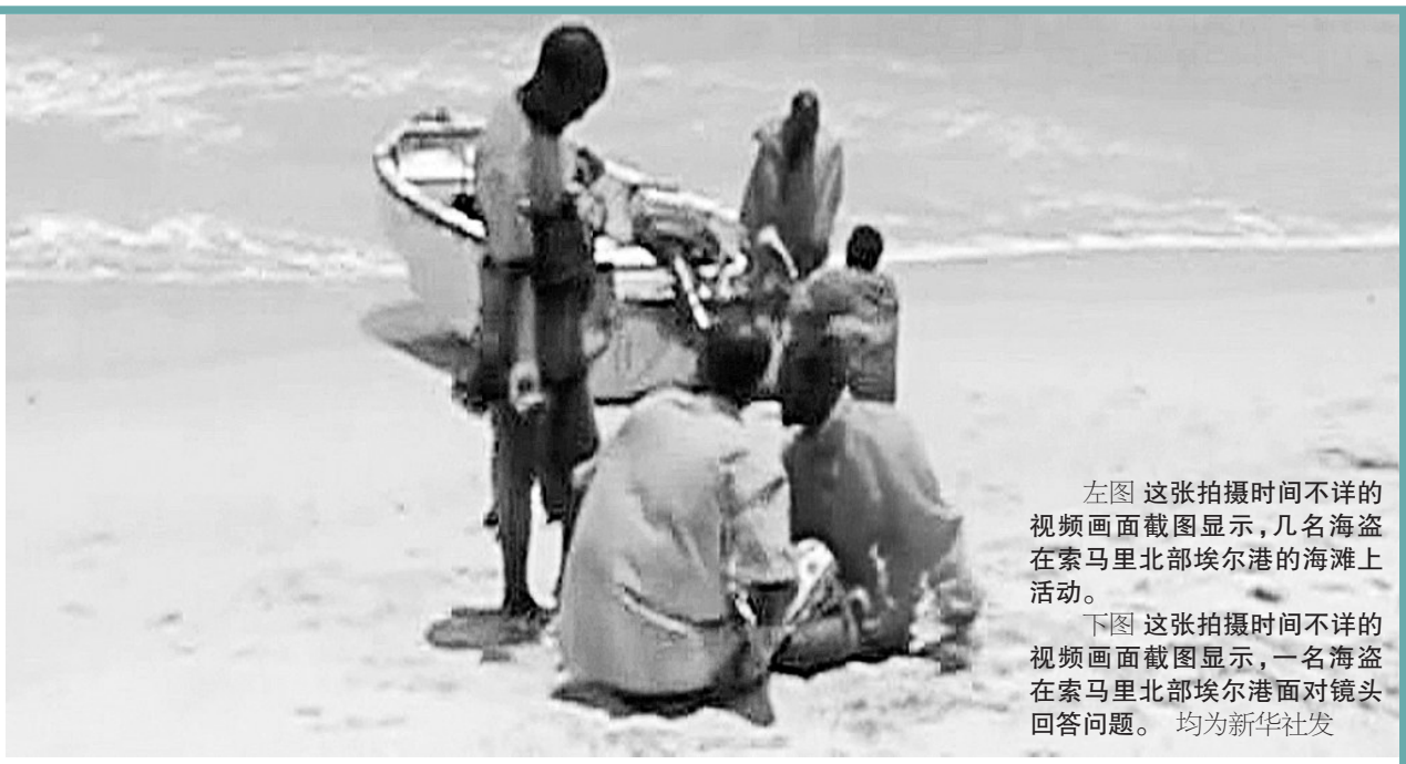
左图 这张拍摄时间不详的视频画面截图显示,几名海盗在索马里北部埃尔蒙港的海滩上活动。

国际海事组织秘书长米乔普洛斯当天建议安理会延长对有关国家参与打击索马里海盗活动的授权期限,继续鼓励有能力的国家积极参与打击海盗活动。