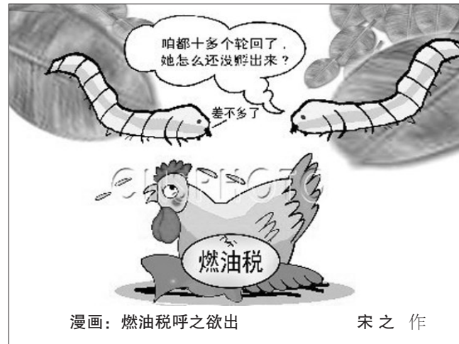
漫画：燃油税呼之欲出 宋之作