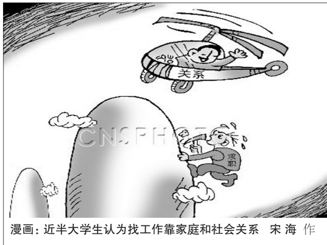
漫画：近半大学生认为找工作靠家庭和社会关系 宋海作

希望提高劳动者收入水平，扩大内需保障民生的政策关爱能够早日细化为可操作、可运行、可监督的“执行方案”，早日让方案中的福利平稳落地。 一舟