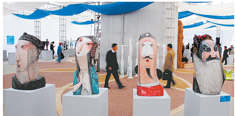
11月25日,两位观众走过雕塑作品《国韵——生旦净丑》。当日,“中国姿态”首届中国雕塑大展在上海长风公园举行。此次大展共展出181件艺术作品,旨在以中国文化意识与哲学精神,为中国雕塑打造一个具有中国风骨的高端学术平台,展示当下中国一流的雕塑艺术作品。

该片将于12月中下旬在中国香港和台湾地区上映,但在内地地上映时间仍未确定,想一睹风采的影迷只能通过图书先睹为快。“暮光之城”系列中文简体版前两部《暮色》、《新月》自2008年7月底由接力出版社相继推出后,上市仅仅三个月发货量已逾13万册。情节更为惊心动魄的第三部《月食》即将于12月上市,而第四部《破晓》以及斯蒂芬妮·梅尔写的另一个超级畅销系列丛书首部《宿主》也将分别于明年4、5月先后上市。