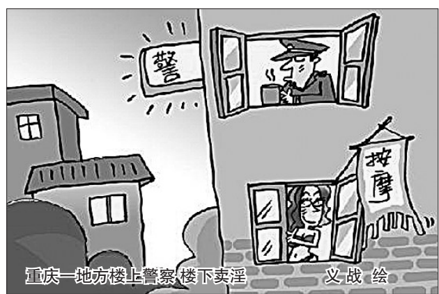
重庆一地方楼上警察楼下卖淫

“黄光裕被调查”的传闻把国美电器和黄光裕本人推向了风口浪尖。有传言称,中国商界的传奇人物、国美电器董事局主席黄光裕已被北京市公安局专案组拘查数天。据传,起因是这位曾经三登润版百富榜的“中国首富”涉嫌操纵市场,对其兄黄俊钦控股的ST金泰股价进行操纵。 不过昨日又有报道说黄光裕已经回家,但确实接受过警方调查。对上述传言和报道,国美发表声明表示,管理层正在核实相关情况。 黄光裕到底有没有被调查,其本人是不是存在着操纵市场的违规行为,在警方未有证实之前,传言终究是传言,别人还不好轻率断定。 然而,近来民营企业出问题的消息可谓接二连三:因涉嫌非法吸收公众存款罪、故意销毁会计凭证罪,中国最大印染企业——浙江龙控控股集团有限公司董事长陶寿龙日前被绍兴县人民检察院批准逮捕;全国人大代表、四川汉唐实业公司董事长谢冰,涉嫌非法集资数亿元被达州警方刑拘…… 民营企业家的成长很不容易,做大一个民营企业更是难上加难。从情感上说,我们很希望自己的民营企业能成长为具有国际竞争力的现代企业,我们的民营企业家能成为社会的道德楷模和责任典范。遗憾的是,不少创业英雄和财富榜样,往往因为对财富的无限贪恋和个人欲望,不知道自爱自重,从而毁掉一个好不容易成长起来的企业。“首富”黄光裕已不是第一次陷入是非之中,早在2006年,黄光裕兄弟就曾因其“第一桶金”涉嫌13亿元的违法违规贷款被有关部门调查过。只不过那一次黄氏兄弟做到了全身而退。 如果说当初人们对部分民营企业“原罪”模式的拷问还可以归咎于国内市场秩序未健全,同时民营企业发展路径也未规范明确的体制缺陷的话,那么时至今日,在资本市场逐渐走向完善、监督也越来越严之际,还抱着以前“第一桶金”时的传统思维做企业,甚至以侥幸的心理继续玩那套“圈钱”游戏,已经行不通了。“混水摸鱼”的时代已一去不返。北京首放投资顾问有限公司老板汪建中领到证监会有史以来最大个人罚金——2.5亿元,就释放出了这样的信号。 做企业,立足的根本还是做大做强自己的实体,而不是有钱后就玩资本游戏,梦想着“空手套白狼”。事实上,企业做好了,公众才会认同,社会给予其回报也就越多。反之,或者操纵市场套现,或者非法集资圈钱,最终只会搬起石头砸自己的脚。 当然,倘若黄光裕真是因为操纵市场而被调查,这也说明我们的市场监管体系还需要进一步完善。黄光裕被调查的传言不但对民营企业家的责任操守敲响了警钟,同时也对市场的监管提出了更高要求。 一条龙