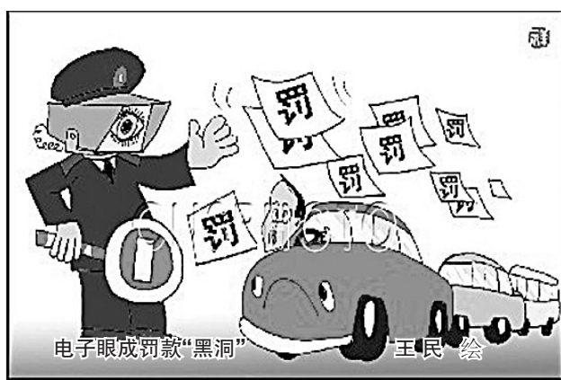
电子眼成罚款“黑洞”