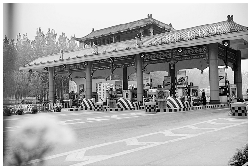
开封收费站古色古香。