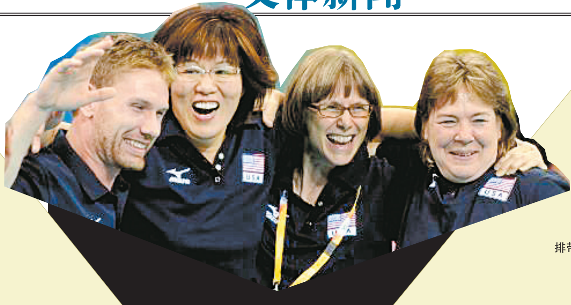
郎平(左二)给美国女排带来了无数的欢乐。