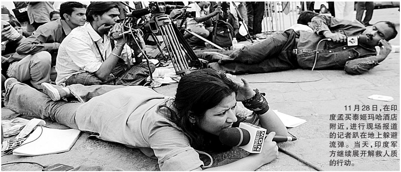
11月28日,在印度孟买泰姬玛哈酒店附近,进行现场报道的记者趴在地上躲避流弹。当天,印度军方继续展开解救人质的行动。

印特种部队28日与袭击者激烈交火,基本控制泰姬玛哈饭店和奥贝罗伊饭店,成功疏散数百名被困人员。