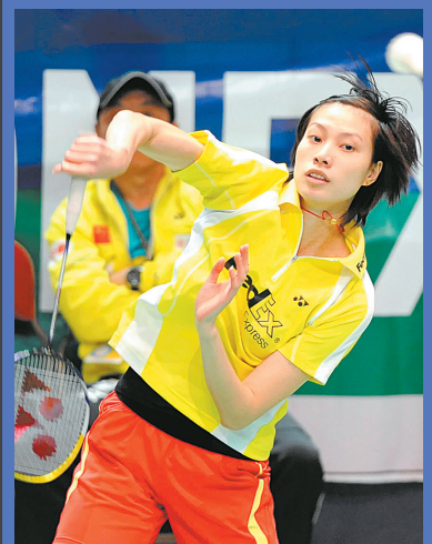
11月28日,中国选手谢杏芳在比赛中扣球。当日,在2008年香港羽毛球公开赛女子单打四分之一决赛中,谢杏芳以2:0战胜保加利亚选手佩蒂娅,晋级半决赛。