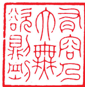
有容乃大 无欲则刚 徐云叔

郑州西部的碧沙岗,早年曾是一个黄沙岗,春秋雨季风沙弥漫,沙埋没了耕地,形成高低起伏的沙丘,长不成庄稼,附近村民只是在岗上栽些树木防风固沙。1928年,时任河南省政府主席的冯玉祥为了纪念他历次作战中阵亡的官兵,在这里修建一烈士陵园,取“碧海丹心,血殷黄沙”之意,将陵园命名为“碧沙岗”。并亲笔书写刻石镶嵌在陵园北大门上(现今建设路路南)。冯玉祥还在陵园内修建有红墙绿瓦,雅静的烈士祠,前后大殿内悬挂匾额,放置烈士姓名的铜牌,记载烈士功绩的金册碑记等。祠堂之前建有民族、民权、民生三亭及水池、石桥。在祠堂之后,建有纵横成排的烈