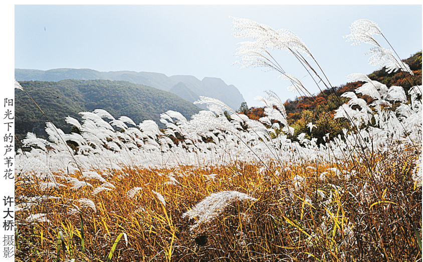
阳光下的芦花

慢慢地,我就不愿再当我哥的跟屁虫了。人一天天大了,爹这时哪里还管得下我,见了,我只气得摇头叹气地用“小土匪”或“贼吃鸡”之类的词戏弄我。镇上演电影哪次台下少得了我?镇上演电影要钱是不错,但我想让我妈去买一回票,那我就不是我了!