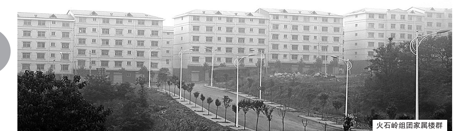
火石岭组团家属楼群 打造新农村 变革新希望 本报记者 李晓光 通讯员 刘二超 文/图

西刘碑村仅仅属于大冶镇22个煤矿沉陷区之一,辖8个村民组654户2335人,2007年农民人均纯收入6300元。是郑州市新农村建设工程重点示范村。由于长期采掘,土地塌陷,房屋开裂,环境污染,资源枯竭等问题日益突出。老百姓的日常生活受到了严重威胁。但是仅靠一直沿袭的在村组内部及小空间范围内反复搬迁无法从根本上克服这些困难。只有统一规划,统一组织,将所有压煤村组的居民全部搬迁到重新规划的人口安置区,才能一劳永逸地解决问题。只有把压煤村组居民全部搬迁出去,才可采储量达三分之一的4000万吨压在居民住宅下面的宝贵煤炭资源才能够充分地开采出来。不仅如此,地下无煤的非塌陷区,由于村庄多数位于低山丘陵地区,农民居住十分分散,两户独居,甚至一户独居的现象比较普遍。他们交通不便,生活困难,同时还造成了大量土地资源的浪费。只有把他们整体搬迁出来落户安置区,才能使这部分人的生产生活方式走上现代化。