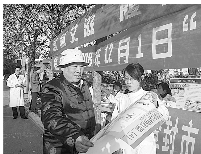
12月1日是第21个“世界艾滋病日”,当天上午,登封市卫生局在嵩山广场举行大规模的宣传咨询活动,通过宣传展板、设立咨询台、发放宣传材料等形式宣传艾滋病的防治常识。

此次重点走访调查城乡结合部等较偏僻地点设立的收购点,重点检查证照是否齐全,字号名称、业主姓名、经营范围、经营期限等项目是否发生变化,前置审批手续是否齐全,切实做好再生资源回收站点的登记工作。行动中,工商执法人员对辖区内的废旧金属收购经营点逐户摸底调查,检查业主废品来源渠道、销售渠道,查验是否收购有国家违禁物资、“三电”设施,在此次专项整治行动中,对该市76户废旧物品回收站点逐个进行了检查,对3户擅自改变经营场所的下发了限期申请变更通知书,对2户无照经营户依法予以取缔,罚款1000元,有力地维护了废旧物资收购市场的经营秩序。