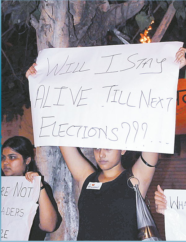
12月3日,在孟买泰姬玛哈酒店附近,抗议者手举有“我能否活到下一次选举?”的标语示威。

弹重大约4公斤。孟买反恐部门高级官员K.P.拉古瓦什介绍,一个拆弹小组迅速赶到,将炸弹拆除,“警方已掌控局势”。