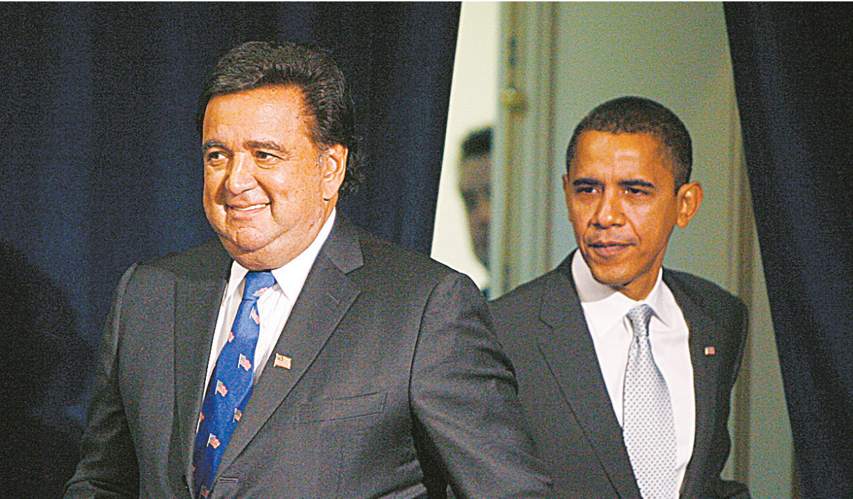
12月3日,美国当选总统奥巴马(右)与新墨西哥州州长比尔·理查森(左)步入在芝加哥举行的新闻发布会现场。当日,奥巴马提名比尔·理查森为新政府商务部长人选,并称理查森将成为美国未来经济外交的主要人物之一。