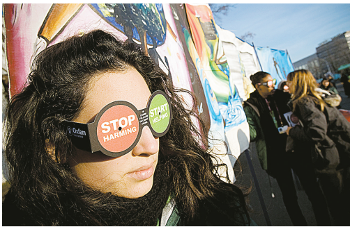
12月4日,在波兰历史名城波兹南,一些环保人士在联合国气候变化大会会场外举行集会,呼吁发达国家减少温室气体排放并帮助穷国减轻气候变化造成的危害。当天,联合国气候变化大会继续在波兹南举行。

针对财政部长弗莱厄蒂上月底公布的2008年经济形势和财政状况报告,反对党自由党、新民主党和魁北克集团指责政府没有采取具体措施刺激经济,对报告有关取消对各政党与政治家补贴的措施表示强烈不满,并于1日签署协议,称将于近期推翻哈珀总理领导的保守党少数政府,并由反对党成立联合政府取而代之。