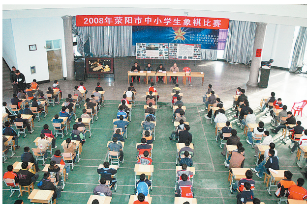
2008年荥阳市中小学生对弈象棋比赛 荥阳是象棋棋盘上楚河汉界所在地。为了发挥荥阳的传统文化优势,让这一活动在荥阳得到普及,荥阳市教体局组织市直和乡镇的四十所学校的108名象棋选手进行了一场少年象棋赛。

以道路绿化为网络,以石河道生态景观轴贯穿全市,一个布局合理、绿量充足、生态健全、景观优美的园林绿化体系已经形成。巩义市园林绿化管理局局长王元茂说,从2002年开始,巩义市区绿化一年一个台阶,目前绿化面积已达858公顷,建成区绿化覆盖率达45.6%,绿地率达39%,人均公共绿地面积达15.7平方米。