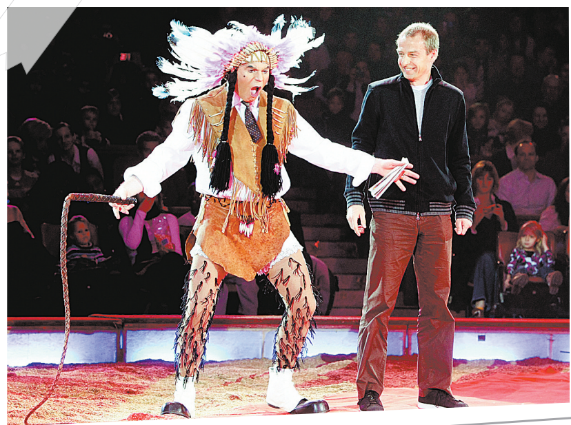
12月8日,拜仁慕尼黑队主帅克林斯曼(右)与演员同台表演。当日,拜仁慕尼黑队在慕尼黑黑队一家马戏团并与演员同台演出。

目前13胜8负火箭队在西部排名榜上被拉下一位到第五,9日他们将在主场迎战排名东部第四位的老鹰队。