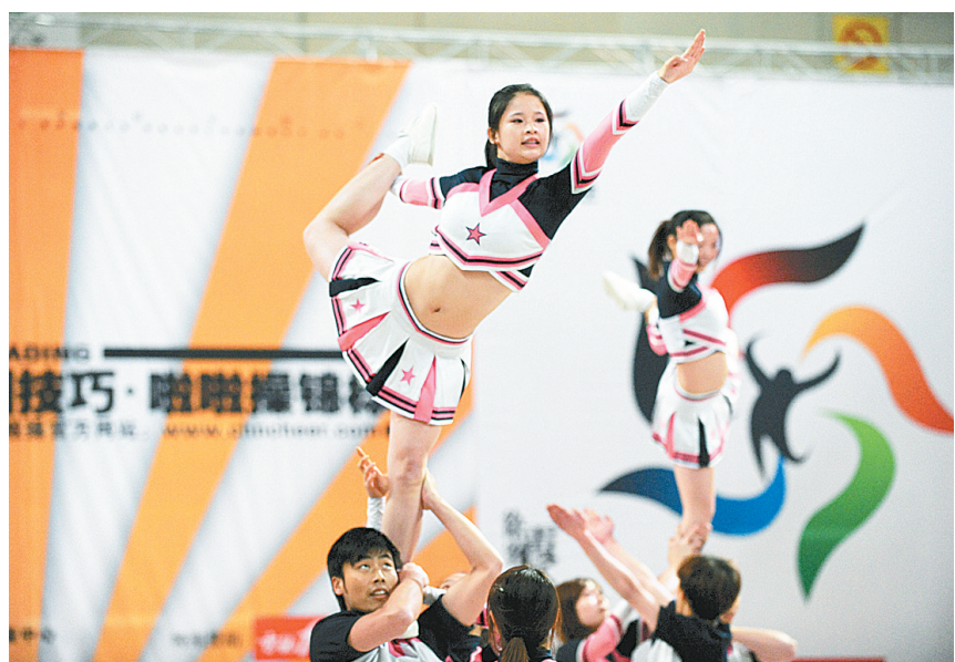
12月9日,武汉大学代表队在比赛中表演。当日,2008全国技巧暨首届拉拉操锦标赛在江苏省江阴市开赛。共有来自全国20多个省市区的25支队伍参加本次比赛。

下半场易边再战,河南女篮及时调整战术,坚决执行围绕尤兰达和纪妍妍组织进攻的“双核战术”,借此重新掌握了场上的主动权。最终,多点开花的河南女篮笑到了最后,以12分的优势,成功“复仇”。