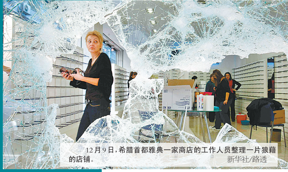
12月9日，希腊首都雅典一家商店的工作人员整理一片狼藉的店铺。

席卷希腊多座城市的骚乱尚未平息，希腊工会团体10日又开始组织全国大罢工，致使航班取消、银行和学校关门，公共交通中断。 希腊应急部门当天严阵以待，以防冲突