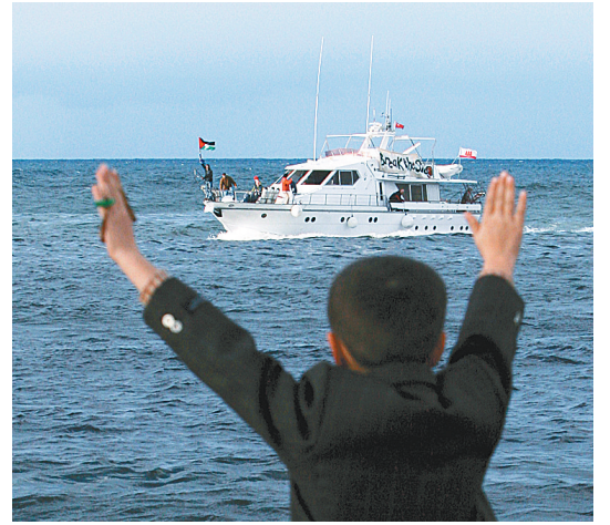
12月9日，一名巴勒斯坦人迎接国际和平人士乘坐的“尊严”号抵达加沙港。这是“自由加沙运动”组织2008年8月以来第四次组织国际和平人士乘船抵达加沙，抗议以色列对加沙的封锁。