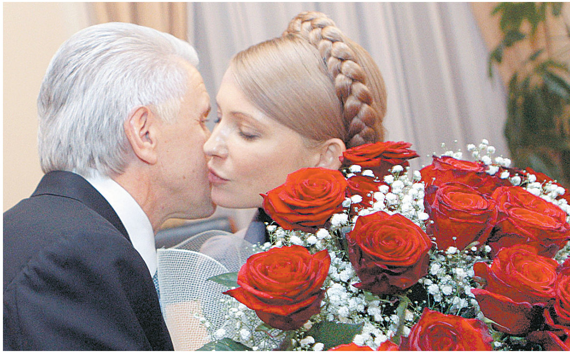
12月9日，在乌克兰首都基辅，乌克兰总理季莫申科(右)向乌克兰新任议长利特温斯基祝贺。乌克兰议会当日组成新的执政联盟，并选举利特温斯基为议长。新执政联盟由季莫申科联盟、“我们的乌克兰—人民自卫”联盟和利特温斯基联盟组成。季莫申科10日宣布，乌克兰国内政治危机结束。

现代企业选址三问：① 能不能以4880元/平方米的价格，占用紫荆商圈百亿经济资源？ ② 能不能以4880元/平方米的价格，分享香港新世界百货的超级奶酪？ ③ 能不能以4880元/平方米的价格，独享写字楼千万自用配套？