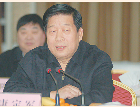
市委原副书记 康定军

在内强素质、外树形象方面还需要进一步建设,应该主动宣传,树立好形象。在质量管理上要加强对医院的质量控制。在网络建设上,三级医疗机构网必须建立,现在省人民医院的床位数已经扩张到3000多张,他们肯定非常希望医疗机构重视。要扫清卫生系统的障碍,一个是医闹事件,必须要保护医务人员的安全;另外应该打击医托,必须通过有关部门有力打击这些事件。要整顿医疗市场,对民营医院加强管理、监督,因为现在非法医疗诊所太多,所以必须打击。目前,我市形成了一些大型综合性医院,但是这些医院都是二级,做一些手术时批不下来,所以要建造大型航母医院,尤其要利用别人没有充分利用的空间。要继续加强人才培养,要借鸡下蛋,汇集人才队伍。