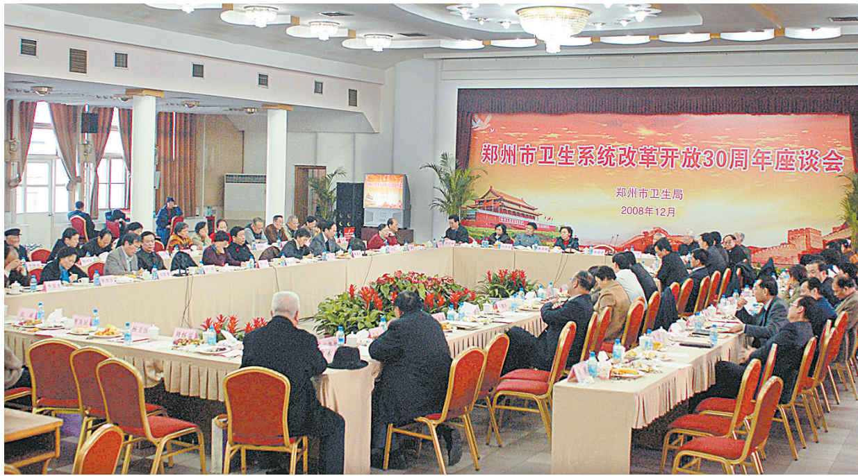
昨日,郑州市卫生系统举行改革开放三十年座谈会。图为会场。

为纪念改革开放30周年,回顾、总结我市卫生事业改革开放以来的光辉历程,全面总结卫生事业进步的成功经验,不断激励全市广大卫生工作者立足本职、无私奉献的工作热情,全面推动我市卫生事业跨越式发展,12月16日下午,市卫生局组织召开纪念改革开放30周年座谈会,邀请主管过卫生系统的老领导、关心关注我市卫生事业发展的老领导、长期奋战在医疗卫生工作一线的老专家等各界人士齐聚一堂,以自己的亲身感受与经历,从多个侧面回顾我市卫生系统改革开放以来的改革历程和宝贵经验,并对今后医疗卫生工作提出了中肯的建议意见。