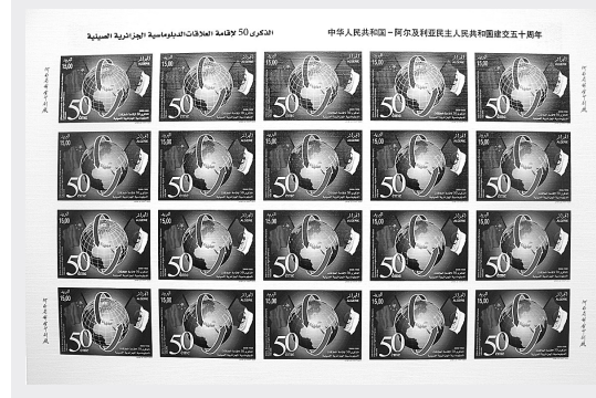
今年,是中国和阿尔及利亚建交50周年。昨日,记者从河南省邮票印刷厂了解到,纪念中阿建交50周年纪念邮票已在该厂开机印刷。该套邮票为一套一枚和一枚小全张。 图为中国和阿尔及利亚建交50周年纪念邮票票样。

本报讯(记者 孙志刚)随着年末临近,不法商家采取欺诈手段蒙蔽消费者的现象有所抬头。昨日,市工商局、市消协联合发布今年第5号消费警示,提醒市民在消费时注意。 据市消协有关负责人介绍,近日,他们接连收到涉及消费欺诈行为的投诉:消费者毕先生到某药房购买了韩国产的高丽参,回家才发现,外包装上写着产地为广东。而马先生在某手机城抽奖活动中,幸运地抽到了“一台价值4990元的笔记本电脑”,但领到的奖品却是一台普通台式电脑。 为了防止消费欺诈行为侵害消费者合法权益,市工商局、市消协提醒消费者:购物时要选择信誉好、有实力的商家。在选择商品时一定要看清楚商品的标识,详细了解商品的有关信息,并认真与商品核对。购物后,一定要索要正规的消费凭证,并要商家按消费凭证的内容详细填写。特别是参加有奖销售、抽奖等活动时,要看清楚活动细则,以免权益受到侵害。发现商家有欺诈行为时,请及时拨打“12315”消费者申诉举报电话投诉。