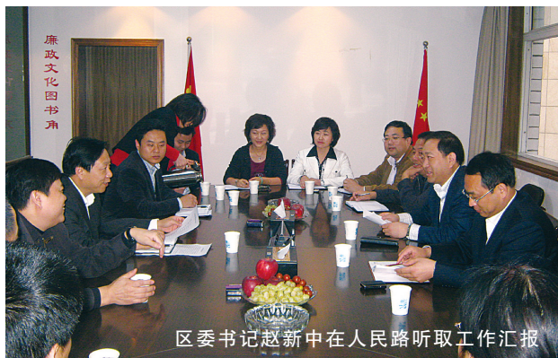
区委书记赵新中在人民路听取工作汇报

转“单位人”为“社会人”，党员走进社区、走上街道听民心、解民忧。长期以来，人民路街道党工委积极在辖区推行机关、企事业单位在职党员单位、社区双重管理模式，通过开展“在职党员8小时外服务社区”、“亮身份、树形象”、“党员就是一面旗”等活动，号召党员们在工作之余，积极投身社区和街道工作，为群众排忧解难，共建和谐社区。“作为党员，工作时间为党员，下班时间更应该是党员，更应该用心服务辖