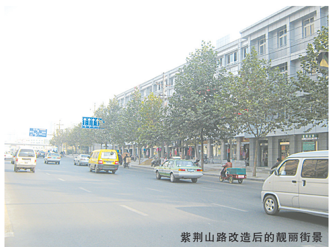
紫荆山路改造后的靓丽街景

正如投资者说的那样，人民路办事处在引导楼宇经济发展的同时，更为辖区楼宇企业营造了一个宽松的投资环境。今年，该办先后引进河南锦展实业有限公司、学大教育科技有限公司郑州分公司等34家知名企业