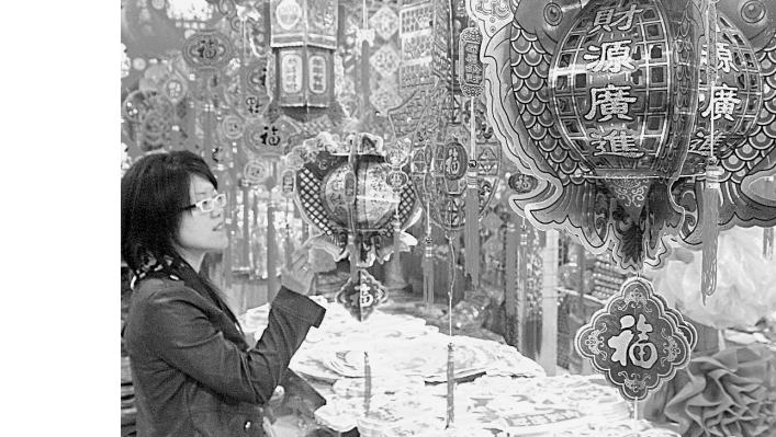
春节临近,年味渐浓。琳琅满目的迎春饰品摆满大街小巷的饰品商场,中国结、红灯笼、福字画、迎春联……金光灿灿、红艳艳的一片,一股浓浓的节日气息扑面而来。

本报讯(记者 成燕 通讯员 张利) 明天就是圣诞节,这一浪漫的西方节日成为郑州众多景区应对“寒冬”的有力契机。记者昨日从省会多家景区了解到,届时,抽奖、免费、寻宝等缤纷活动将引领市民过一个“花样圣诞”。 据了解,圣诞节当天,凡到巩义浮戏山雪花洞参观的游客,均可得到景区赠送的精美圣诞贺卡,并可参加抽奖;凡圣诞节出生的游客凭身份证可免该景区门票。新密神仙洞景区早已把洞内灯光进行了