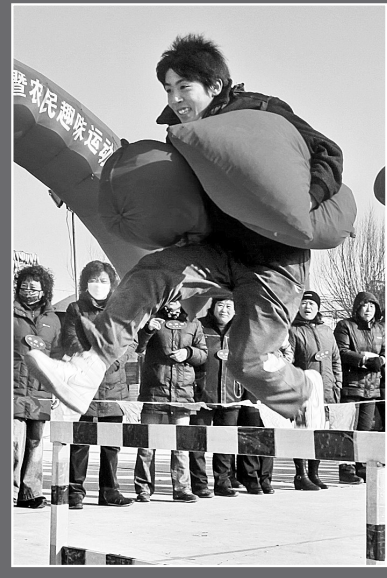
24日，一名村民在北戴河集发现光园举行的农民趣味运动会上参加运送“沙包”比赛。当日，秦皇岛市北戴河区举办农民趣味运动会，近1000名农民参加了颗粒归仓、运菜忙、插秧接力等9个项目的比赛。