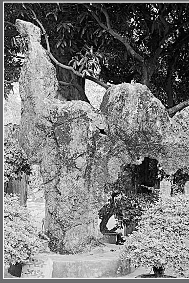
云南勐巴娜西珍奇园内的一块酷似公鸡造型的奇石(23日摄)。位于云南省德宏傣族景颇族自治州陇川县国家4A级景区勐巴娜西珍奇园，荟萃近千种罕见的奇石、化石和树化石、黄龙玉精品及大型根雕等，其中有上亿年历史的硅化石和各种造型奇特、酷似动物或人物的奇石，惟妙惟肖。