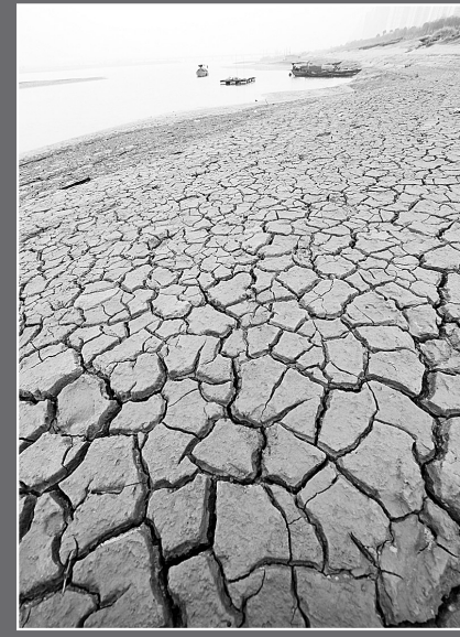
赣江南昌段北岸干枯的河滩(24日摄) 11月中旬以来，江西境内降雨稀少，赣江水位全线回落，继中游吉安、樟树、丰城等水文站突破历史最低水位以来，12月21日，南昌站水位再跌破极值，达到13.55米，比历史最低水位(13.61米)还低0.06米。

——促进房地产业平稳发展。要认真分析和研究房地产市场形势，正确引导和调控房地产市场；加快保障性住房建设，加大廉租房、经济适用房等保障性住房建设规模；落实和完善促进合理住房消费的政策措施，促进中小户型、中低价位普通商品房开发建设，加快发展二手房市场和住房租赁市场；从严格控制廉租房租金，规范地方政府土地出让行为，抑制地价过快上涨。