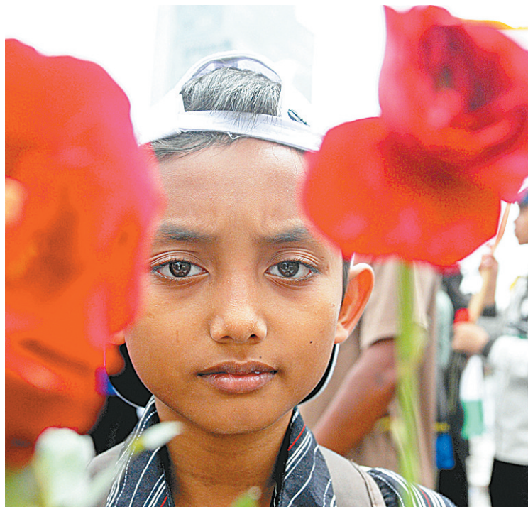
印尼儿童为巴勒斯坦儿童祈祷。

以军从27日开始的空袭行动已造成巴勒斯坦390人死亡,另有1900余人受伤。以军表示,如有必要将在加沙地带采取地面军事行动。