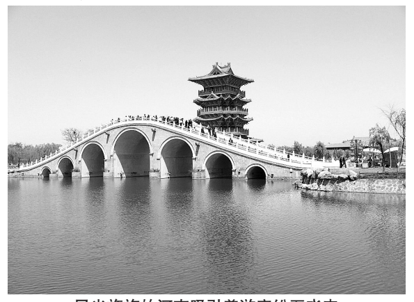
风光旖旎的河南吸引着游客纷至沓来

我省并不缺少旅游商品，新郑大枣、开封汴绣、洛阳唐三彩、南阳玉石、许昌钧瓷等产品都独具特色，却尚未成为知名品牌。对此，省旅游局初步规划了40个旅游产品生产基地，对名优旅游商品的开发给予扶持。种种迹象表明，河南旅游业的发展正在提速。