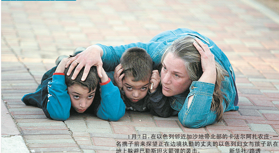
1月7日,在以色列邻近加沙地带北部的卡法尔阿扎农庄,一名携子前来探望正在边境执勤的丈夫的以色列妇女与孩子在地上躲避巴勒斯坦火箭弹的袭击。