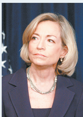
南希·基利弗曾担任过克林顿政府财政部的助理部长和首席运营官,目前在一家管理咨询公司任职,是一名经验丰富的绩效管理专家。

据新华社1月7日电 美国当选总统奥巴马7日任命前财政部副部长南希·基利弗(女)为白宫首席绩效官,专门负责监督新政府的行政效率并制止行政浪费。