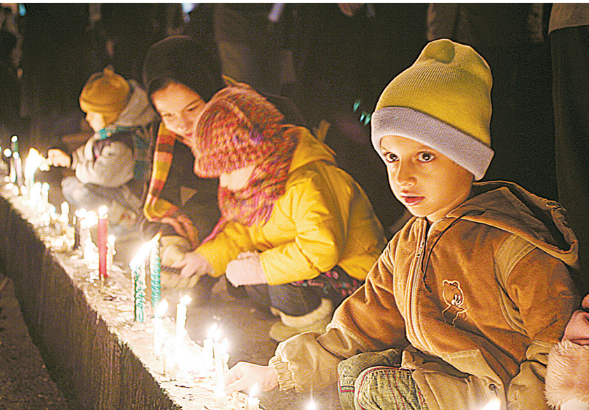
1月7日,在伊朗首都德黑兰市中心的巴勒斯坦广场,伊朗儿童点燃蜡烛为战火中的加沙儿童祈福。当晚,成千上万伊朗民众在巴勒斯坦广场举行阿舒拉节特别集会,声援遭受以色列军事行动之苦的加沙民众。

据新华社1月7日电 美国白宫发言人佩里诺7日发表讲话,呼吁以色列和哈马斯立即停止在加沙地带的军事冲突。她还说,美国希望了解埃及提出的停火建议的详细内容。 佩里诺在此间举行的新闻发布会上说,美国非常关注在加沙地区出现的日益恶化的人道主义危机,希望巴以双方迅速达成一项持久的停火协议。她说:“我们的目标是实现加沙生活的稳定和正常,以及恢复巴勒斯坦民族权力机构主席阿巴斯”的领导权。”