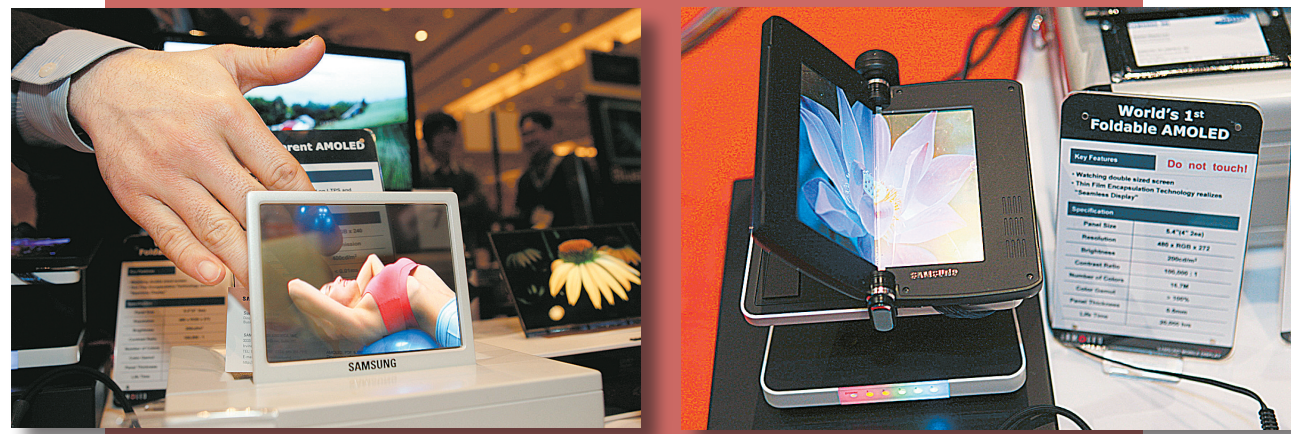
一年一度的拉斯维加斯国际消费电子展是全球消费电子厂商发布、展示新产品和新技术的最大舞台之一。第42届国际消费电子展于1月8日正式开幕。 左图:1月7日在国际消费电子展上展出的第一款半透明液晶屏。 右图:1月7日在国际消费电子展上展出的第一款配置可折叠液晶屏的手机。