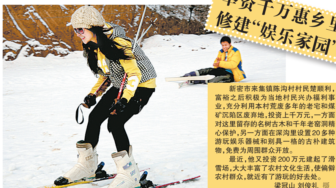
举资千万惠乡里 修建“娱乐家园”

比往年相比减少很多。位于鲁庄镇中南部的巩义市2008年农业开发工程虽然尚未全部完工，但工程的导流明渠、提灌站等已经竣工，渠系已经基本完备。为了农作物抗旱和抗寒的需要，巩义及时协调陆浑灌渠开闸放水抗旱，并把陆浑灌渠水通过工程渠系引入项目区。巩义要求鲁庄镇并逐条渠、逐块地检查水流、渠道情况，使农业综合开发工程顺利通过了“实战”考验。