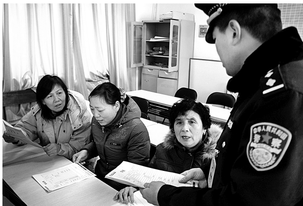
南关街道办事处豫丰社区的几十位生活困难的下岗纺织女工,每人收到了一份特殊的爱心慰问礼品。9日,市公安局民警将免费《健康体检表》送到了她们手中。