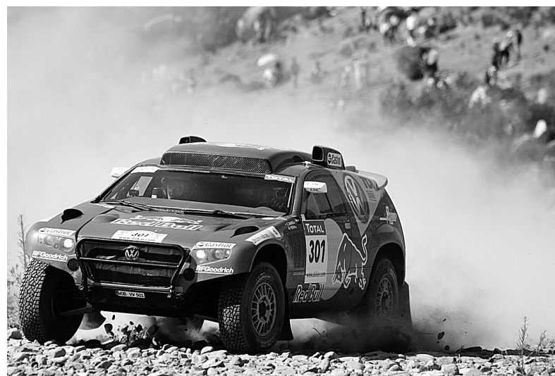
1月11日,大众车队的西班牙车手塞恩斯和法国领航员佩里在比赛中。他们以3小时47分19秒的成绩获得本赛段汽车组第一名,并保持总成绩第一的位置。当日,2009年达喀尔拉力赛结束第八赛段的比赛。本赛段是从瓦尔帕莱索出发,终点设于拉-塞雷那,全长652公里。

在基本上敲定两位洋将之后,俱乐部副董事长杨楠和主帅唐尧东的南美之行也即将开始启动,近日,南美多名外援的资料送达建业俱乐部,教练组经过观看录像之后,将对印象不错的外援进行重点观察。