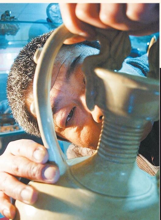
坎坷经历给了老侯一双明亮的眼睛