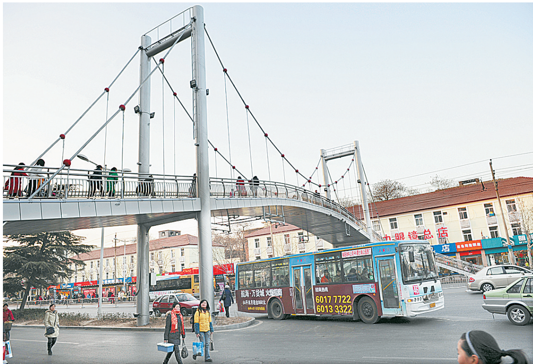
临近春节,修饰一新的建设路过街天桥恢复通行,市民购置年货和穿越马路更加方便、安全。