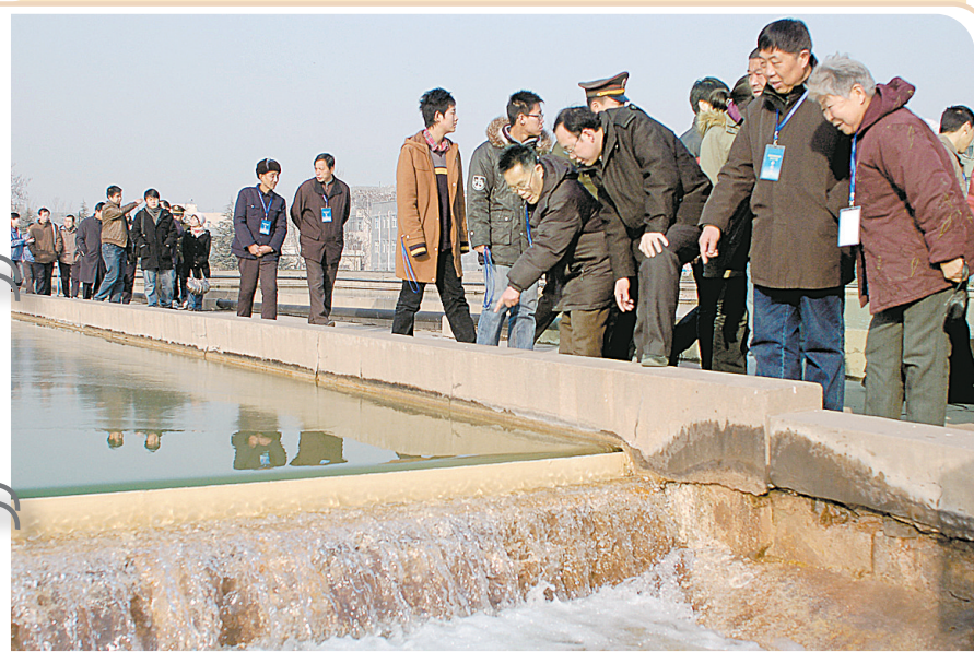
昨日是大年二十三,郑州市自来水总公司柿园水厂邀请了市贫困家庭的27位代表参观了水厂制水的工艺流程,并和供水职工们一起吃麻糖、饺子,度过了一个其乐融融的小年。