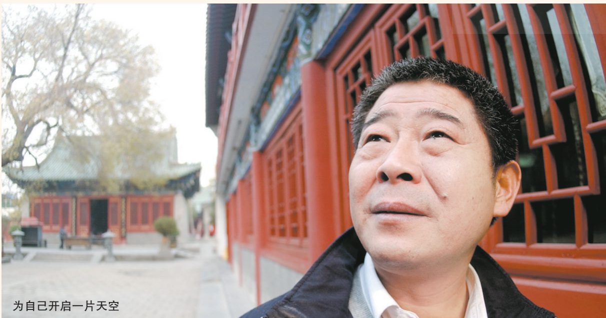
为自己开启一片天空