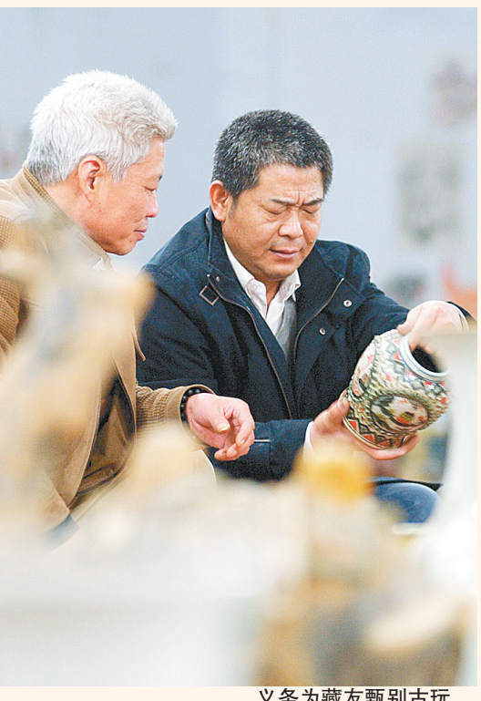
义务为藏友甄别古玩