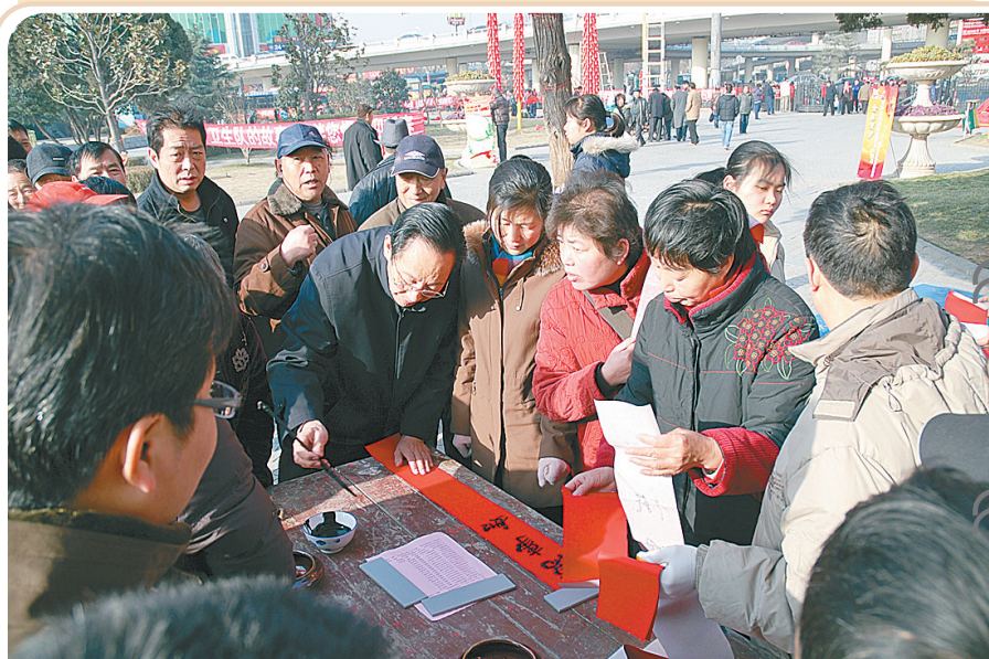
昨天是传统小年,紫荆山公园邀请了十几名省会知名书法家在紫荆山广场为游人书写春联,赠送吉祥。

在二七区京广路小学,学生们今年寒假则要完成一份特殊的“作业”,春节拜年时不要压岁钱,向父母“讨句压岁言”,讨教可以帮助自己发展、成长的话语,并趁着假期与父母交换一本自己喜欢的书,感受长辈们的人生体验。该校校长景松峰认为,学生们平时与父母交流得很少,借这次活动能让亲子之间彼此敞开了心扉,感受到相互之间的爱。