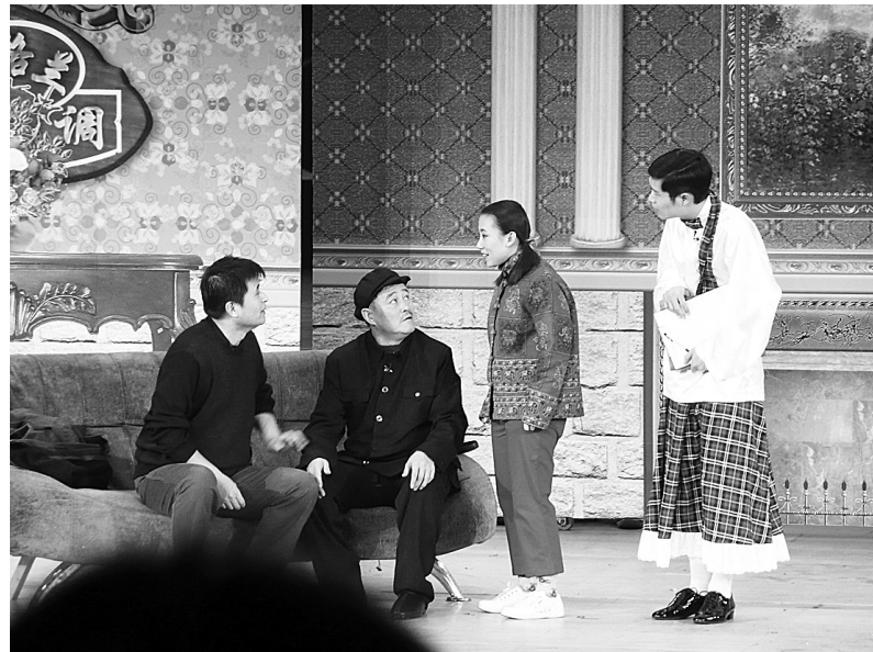
小品《不差钱》正在彩排。