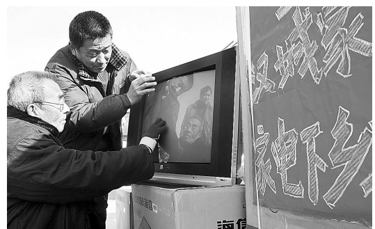
昨日,惠济区政府举行“欢乐购物过大年”家电下乡活动,100多家食品百货批发商及家电销售商参加了启动仪式。

新华社北京1月20日电(记者 赵晓辉 陶俊洁)环球金融服务集团ING20日发布的ING投资者情绪指数季度调查报告显示,2008年第四季度中国投资者情绪指数从第三季度的88上升到103,投资者信心出现反弹。中国成为印度尼西亚之后的亚洲第二乐观市场。调查表明,与2008年三季度相比,更多的中国投资者认为2008年第四季度整体经济状况有所恶化,但认为个人财务状况恶化的投资者人数有所减少。进入2009年,尽管美国经济仍在恶化,但数据显示,中国投资者对国内整体经济和个人财务状况的发展趋势已变得更加乐观。根据调查,50%的中国投资者预计2009年第一季度整体经济将有所改善,而上一季度仅有38%的投资者认为整体经济将有所改善。另有54%的中国投资者预计今年第一季度个人财务状况将有所改善。报告认为,在信贷紧缩和美国经济下滑的情况下,中国政府2008年11月公布的4万亿元刺激经济措施是2008年第四季度中国投资者情绪出现反弹的关键因素。