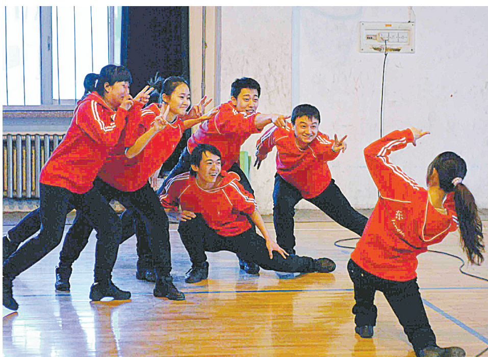
2月3日,参加第24届世界大学生冬季运动会开幕式文艺演出的演职人员加紧排练。本届冬奥会将于2月18日在哈尔滨举行。