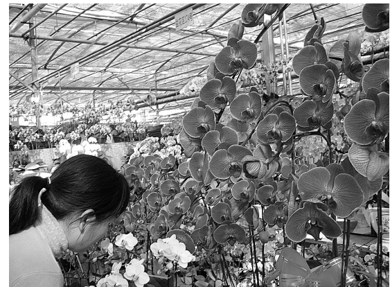
昨日元宵节,记者在北环某花卉市场看到,这里生意正好。蝴蝶兰、春雨、满堂红等花开得千娇百媚,颇为吸引人眼球。