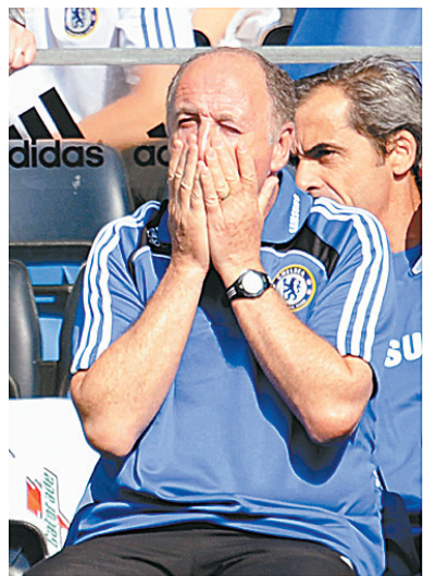
2月9日,切尔西俱乐部在官网上宣布解雇巴西籍主教练斯科拉里。他是连续第四个被炒的切尔西主帅,这名巴西人在“蓝军”主帅的位子上只呆了七个月。

玛雅德目前已抵达昆明,据悉,除了玛雅德外,近期还将有多名外援陆续“上山”随建业队试训。