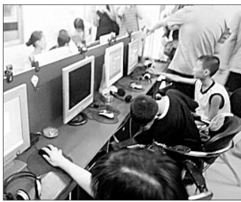
小孩沉迷网吧彻夜不归

更有网友说,“沉迷在网络中的他就以为,网络游戏中打打杀杀的太多,把机器重启一下,他父亲就会复活了,就像游戏里杀不死的