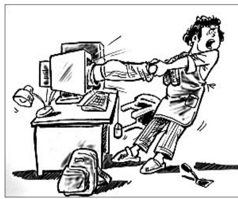
漫画:谁救救我的孩子 张耀宁 绘