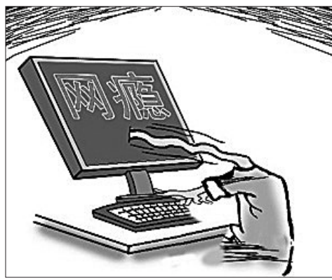
漫画:网瘾被列为精神疾病