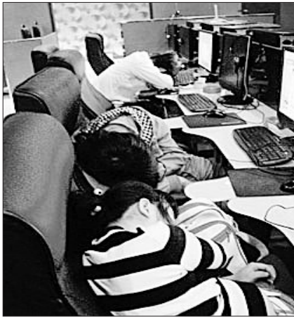
众多年轻人通宵泡在网吧