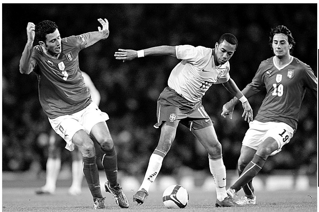
2月10日,巴西队球员罗比尼奥(中)在比赛中带球突破。当日,在伦敦举行的一场国际足球友谊赛中,巴西队以2:0战胜意大利队。