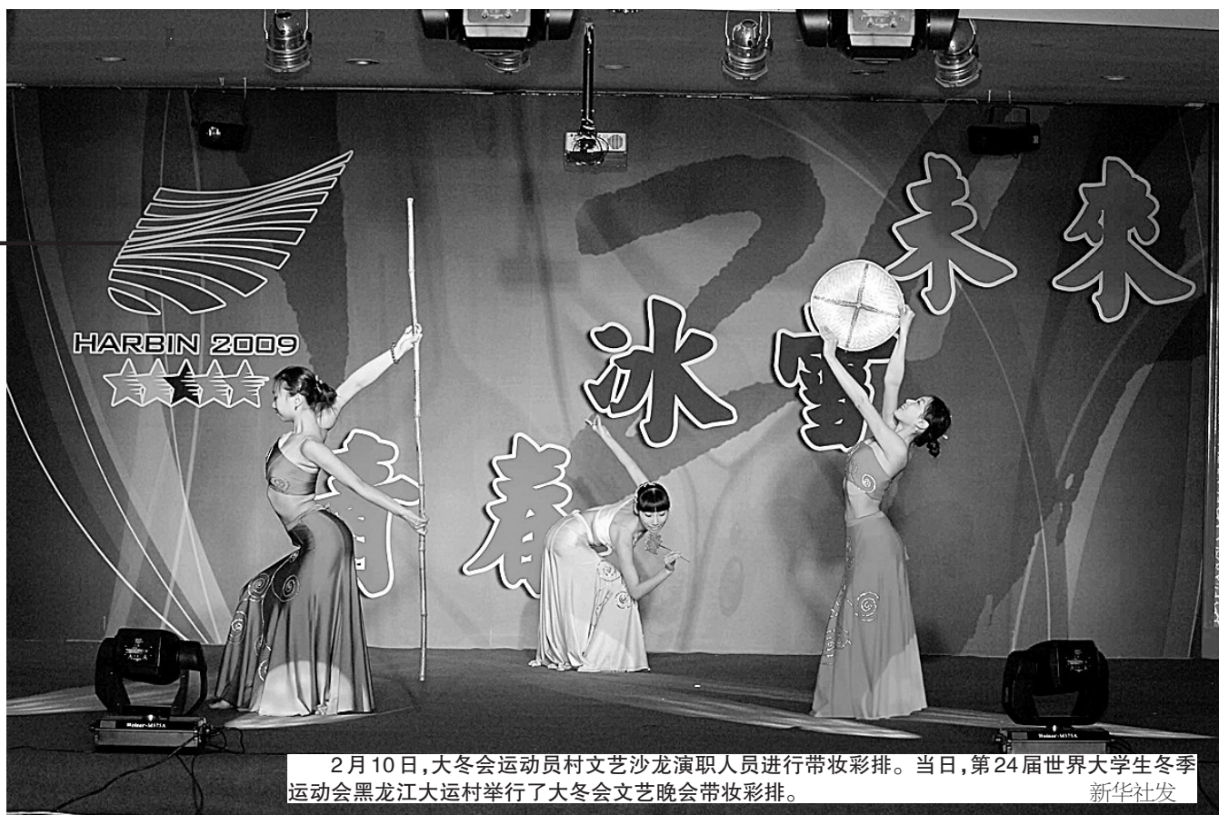
2月10日,大冬会运动员村文艺沙龙演职人员进行带妆彩排。当日,第24届世界大学生冬季运动会黑龙江大运村举行了大冬会文艺晚会带妆彩排。