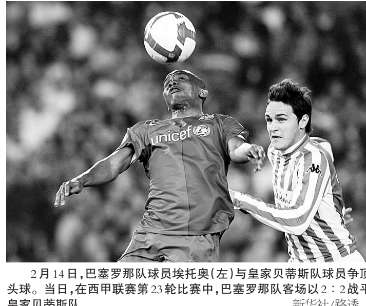
2月14日，巴塞罗那队球员埃托奥(左)与皇家贝蒂斯队球员争顶头球。当日，在西甲联赛第23轮比赛中，巴塞罗那队客场以2：2战平皇家贝蒂斯队。