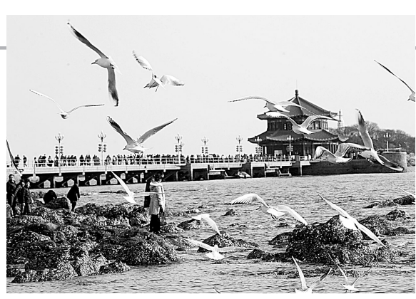
2月18日,一群海鸥在栈桥海边飞翔盘旋。连日来,随着青岛市天气逐渐回暖,沿海一线聚集了成群海鸥在穿桥觅食,引得不少游客前往观看。

格考生名单。根据规定,体育专项测试合格的考生须在其户口所在地参加普通高校招生全国统一考试。对体育专项测试合格,文化成绩达到要求的考生,招生院校须按照向社会公布的录取规则进行录取。招生院校单独组织的文化考试标准,均不得低于高中毕业考试要求。教育部在通知中声明严禁各校擅自降低录取标准、扩大规模、增加项目录取考生。严禁以高水平运动员招生形式录取未经教育部集中公示的考生。