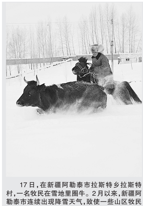
17日,在新疆阿勒泰市拉斯特乡拉斯特村,一名牧民在雪地里圈牛。2月以来,新疆阿勒泰市连续出现降雪天气,致使一些山区牧民的牲畜受困。

会议强调,推进西藏生态环境保护和建设要科学规划。继续开展退牧还草工程,加大防沙治沙工作力度,促进天然草地恢复;加强自然保护区、湿地和防护林体系建设,强化森林防火、有害生物防治和野生动植物保护,提高森林覆盖率;推进小流域综合治理,改善重点治理区生态系统;推进农牧区传统能源替代工程,积极实施小水电代燃料、农村沼气和太阳能建设;积极推广先进适用技术,加强监测体系和能力建设,提高生态治理的科学性。