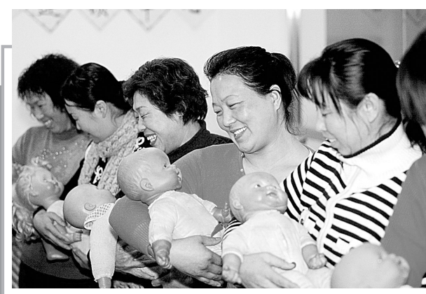
18日,学员在学习新生儿护理技能。为提高月嫂的家政服务技能和服务质量,辽宁省一家政连锁中心开办了月嫂免费培训班。