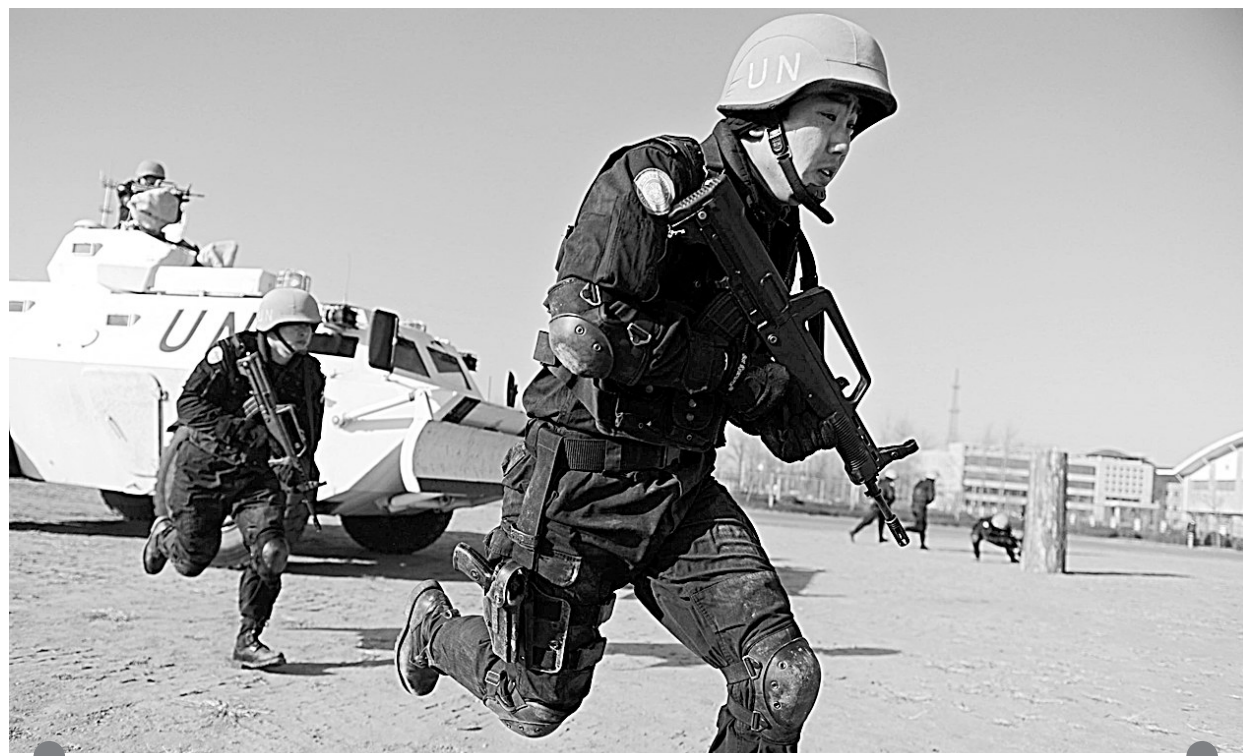
17日,维和防暴队进行解救人质演练。当日,以山东公安边防总队为主组建的中国第八支赴海地维和警察防暴队的120多名队员,在位于河北廊坊的中国维和警察培训中心顺利通过联合国的甄选和评估。队员们将于4月赴海地执行国际维和任务。

的数量是有限的,不存在在外资大量逃出的现象。利润汇出和撤资是一种商业行为,符合外汇管理的规定,是正常的合法行为。他强调,有些撤资是境外母公司出现了经营困难,抽身回国自保,并不是说他们对中国的市场丧失了信心。我国经济的基本面没有改变,中国市场对外资仍然有长期的吸引力。目前,外汇局外汇管理制度和管理手段渐趋完善,拥有打击非法买卖外汇交易的能力以及国际收支预警机制和应急预案。邓先宏表示:“我们有能力控制跨境资金大进大出的局面。”