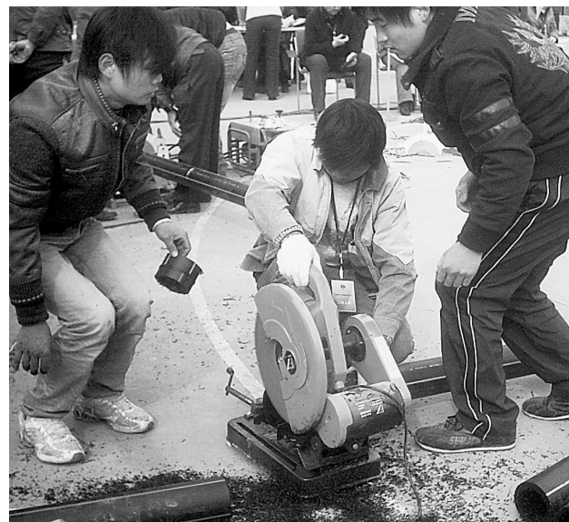
昨日,郑州燃气工程建设有限公司对施工一线的135名焊工进行了PE管焊工培训考试。成绩不及格者,禁止从事PE管焊接工作。

为加大对受侵害消费者的救助力度,今年,我省将适时建立省消协消费者投诉法律援助中心,聘请有关专家和知名律师担任法律顾问,为消费者提供法律援助。