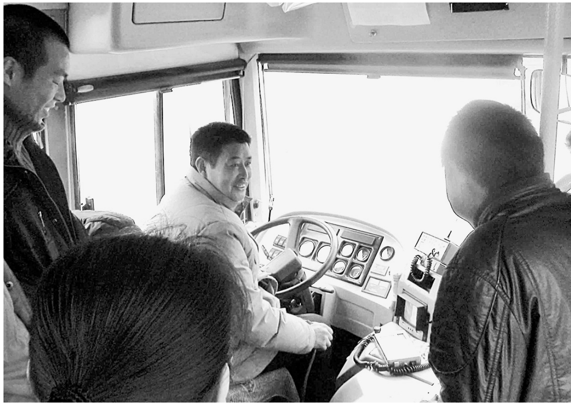
市公交二公司将车长驾驶技能列入年度培训范围,昨日,公司开展练兵活动,邀请有近40年驾龄的老师傅,为近百名新车长传授驾驶经验。