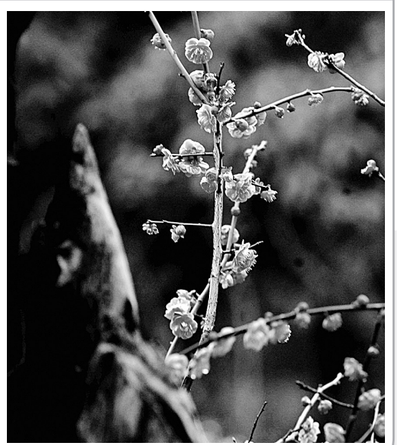
2月19日,杭州余杭区超山的一株宋梅花开。