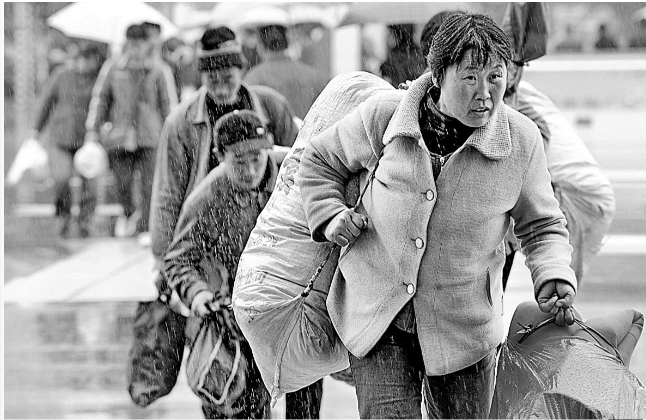
19日,旅客在福州火车站广场有序进站上车。当日,中国铁路春运结束,共运送旅客1.92亿人次。

公路方面,今年春运期间,全国共投入76万辆大中型客车,平均日发班次210万个,共完成道路客运量21.1亿人次。