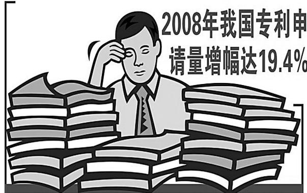
2008年我国专利申请量增幅达19.4%

据了解,质监系统的举报投诉专线“12365”具有特殊的含义:12代表一年12个月,365代表一年365天,寓意质监部门天天为消费者服务。河南开通“12365”质监投诉举报热线,将为假冒伪劣织下一张法网,保护消费者和企业的合法权益。