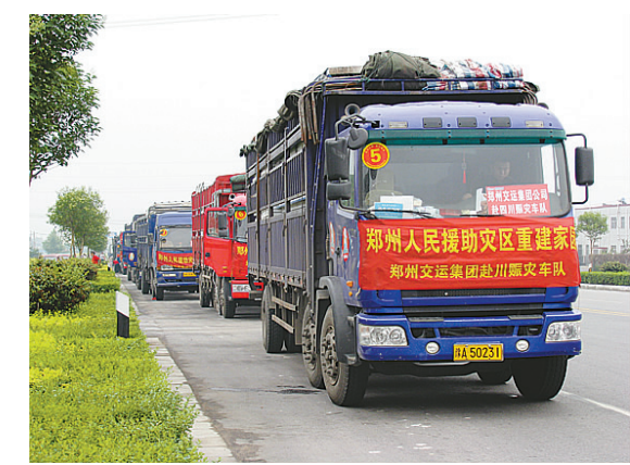
“5·12”地震发生后,郑州交运集团积极支援四川抗震救灾工作。图为郑州交运集团抗震救灾运输车队正奔赴四川抗震一线。