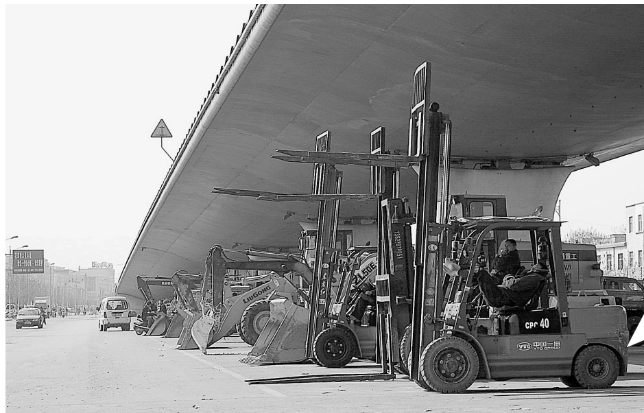
房地产遭遇寒冬,建筑机械也受到冷落。昨日,记者在西环立交桥下看到,往日备受青睐的建筑机械设备闲置,许多工人坐在自己的工程车上等待雇主。

另据了解,为大力刺激旅游消费,今年春季,不少旅行社在线路中增加了游览景点、提高了接待标准,但是并没有提高价格。