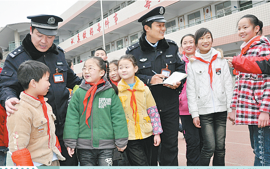
24日上午,金水公安分局沙口路派出所民警走进辖区学校,开展“走访学校保平安”活动。连日来,该局基层派出所500多名社区民警走进辖区26所中、小学校和幼儿园,用不同的形式开展活动,征求意见。