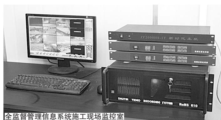
全监督信息管理系统施工现场监控室

本报(记者 孟斌)建筑工人操作是否规范,现场事故隐患有没有整改,安全人员有没有上岗,施工材料是否按要求堆放,监管人员通过现场安装的“摄像头”,就能在任何时间和地点进行查看。为有效防止和杜绝重特大生产安全事故,市建委颁布了《郑州市建设工程施工现场安全监督管理信息系统实施办法》,要求自2008年12月15日起,凡新开工的市直管建设工程,施工现场必须接入郑州市建设工程施工现场安全监督管理信息系统。