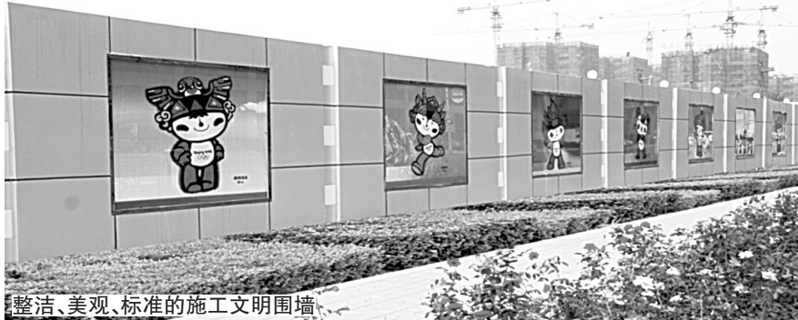
整洁、美观、标准的施工文明围墙

河南锦源建设有限公司 河南中森建设工程有限公司 郑州天立模架工程技术有限公司 郑州市邙山区第五建筑工程有限公司 河南黄埔建筑安装有限公司 郑州恒基建筑安装工程有限公司 河南华盛建设集团有限公司 河南新建建设工程有限公司 郑州市管城建筑安装工程有限责任公司 郑州市市政工程总公司 河南恒兴建设工程有限公司 河南恒盛市政园林绿化工程有限公司 河南省交通建设工程有限公司