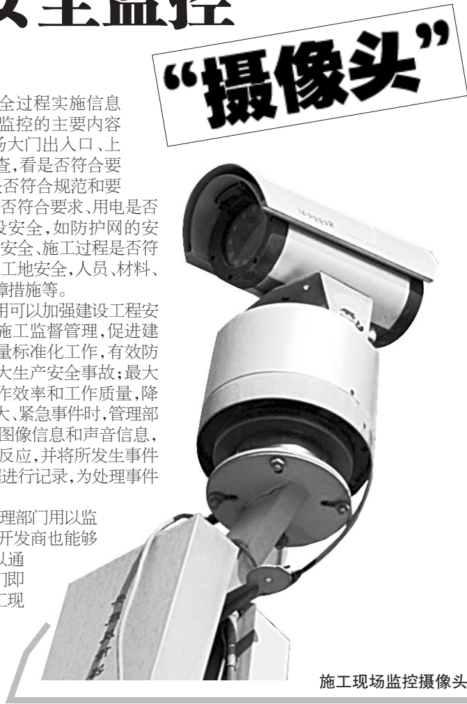
施工现场监控摄像头

该系统建成后,除市政府管理部门用以监督管理使用外,相关的投资商、开发商也能够看到现场的施工情况,他们可以通过互联网登陆核心平台,使他们即使不在工地也能随时了解到施工现场的各种信息。