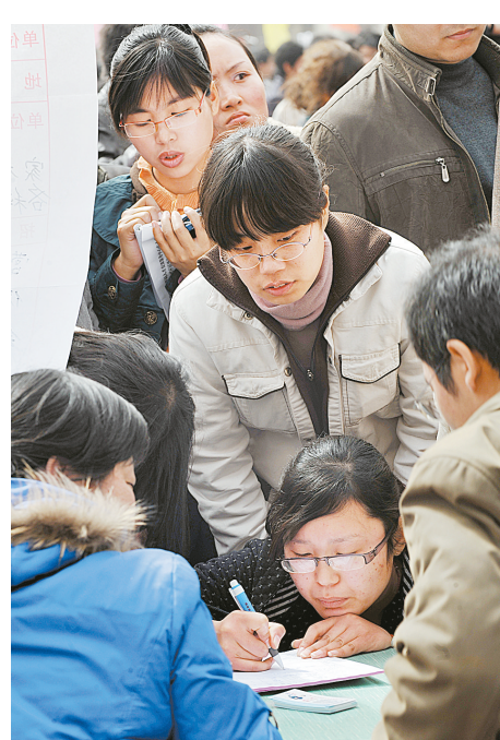
▲毕业生在招聘会上同招聘单位代表洽谈。