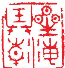
星海弄潮(篆刻) 杜羲

宗李世民派遣，出使突厥，和颉利结盟，以稳其心。回朝后对太宗李世民说：“戎狄衰，以牛羊为准，这次突厥牛羊多冻死，不过三年，突厥必败。”后果如其言。唐贞观盛世，击败颉利可汗，突厥领土归入大唐。郑元寿后升任左侯大将军、宣州刺史。贞观二十年(公元646年)卒，朝廷赠幽州刺史，谥曰昭。郑元寿一生五次出使突厥，为双方避免战争，对安定边疆发展生产、贞观盛世，作出了巨大贡献。