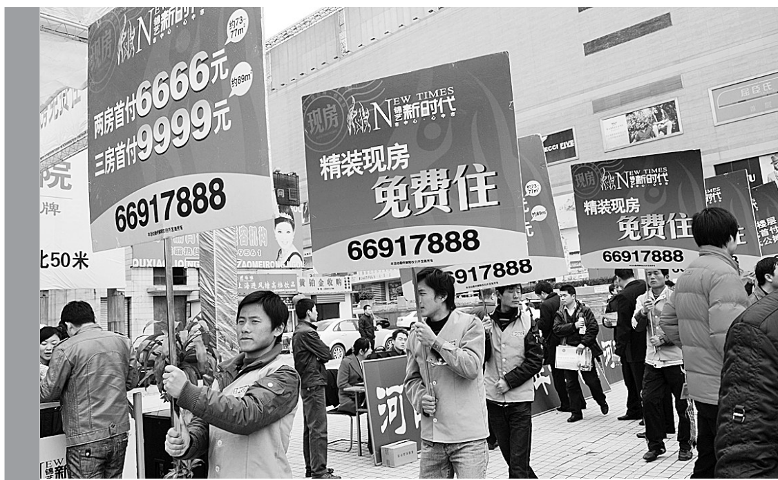
房地产市场逐步回暖,开发商使出浑身解数进行促销,吸引眼球。

当日沪深两市分别成交1146.39亿元和598.00亿元,较前一交易日大幅放大。